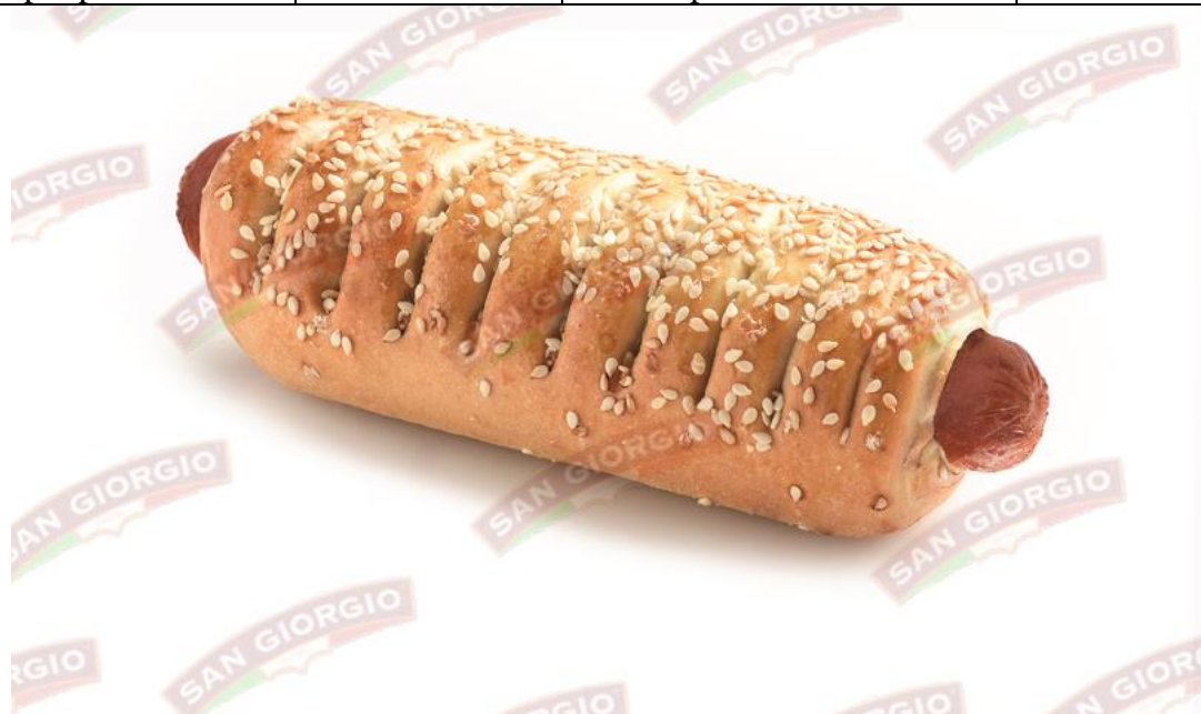
La foto è solo a scopo puramente illustrativo