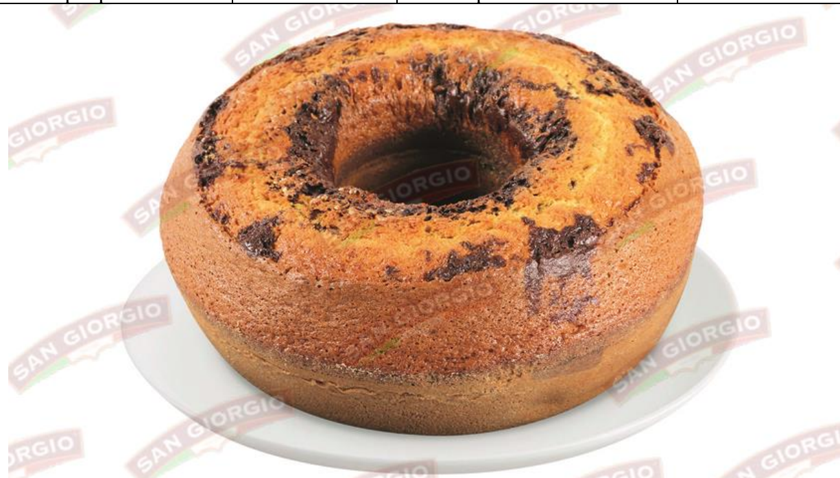
La foto è solo a scopo puramente illustrativo