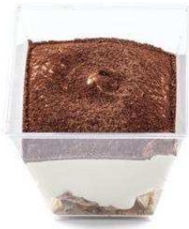
Immagine a scopo illustrativo

PRODOTTO DOLCIARIO CONGELATO SPECIFICAMENTE FORMULATO PER CELIACI